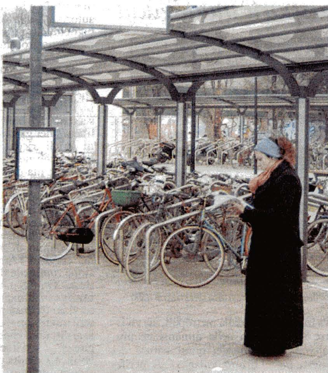
FUTURO La stazione delle bici diverrà una tappa del Parco (N.P.)

re ai dipendenti di coprire brevi distanze in città senza inquinare. Da tempo infatti la cittadella degli idrocarburi sta sperimentando con alcune società del gruppo Eni e altri grandi multinazionali presenti sul territorio comunale la possibilità di avviare concretamente il car polling tra i propri dipendenti. Un ulteriore passo che attende ancora di decollare.